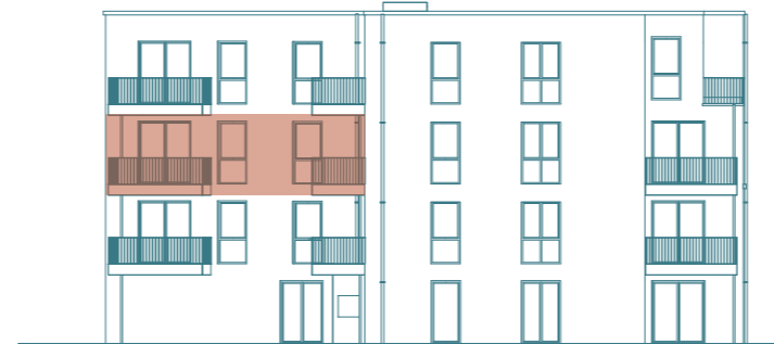
Rückansicht (Nord) - Haus 1