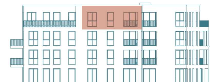
Seitenansicht (West) - Haus 1