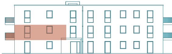
Frontansicht (Ost) - Haus 2